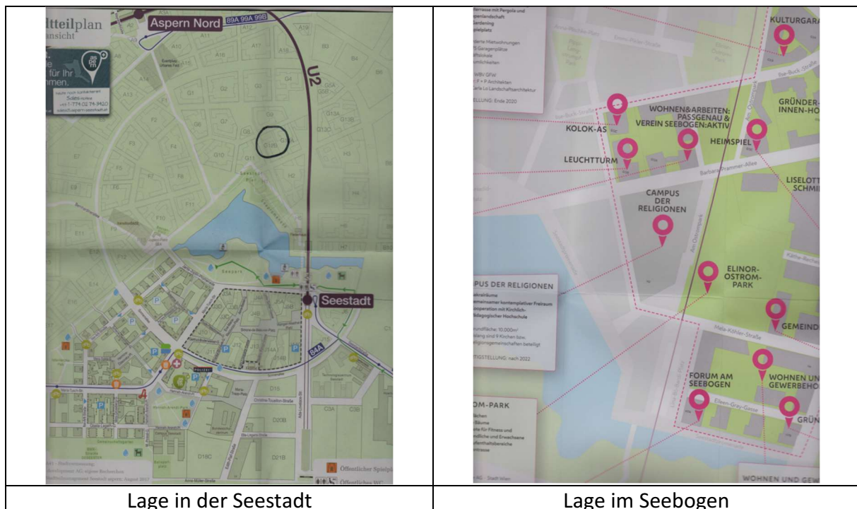
Lage in der Seestadt