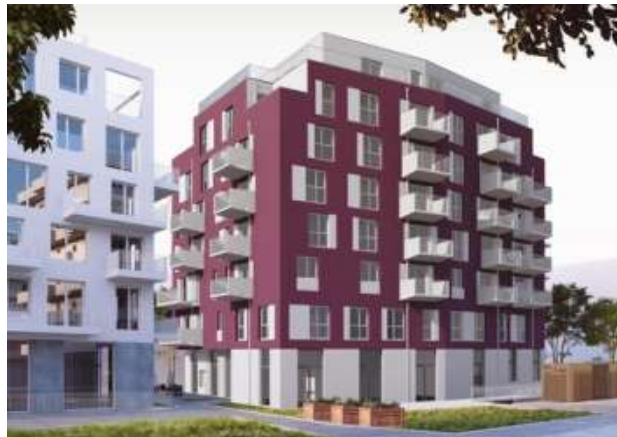
Ansicht hofseitig, süd-ost (asynchron)

Das Wohnhaus „kolok-as: kolokation-am-seebogen“ in der Seestadt Aspern wird von der Wohnungsgesellschaft Schwarzatal errichtet (voraussichtlicher Bezug: August/September 2021). Das Haus wird 41 Wohnungen enthalten. Es handelt sich dabei um ein innovatives Konzept von kolokation, das nach dem WWFSG 1989 (Wr. Wohnbauförderungs- u. Sanierungs-Gesetz) gefördert wird.